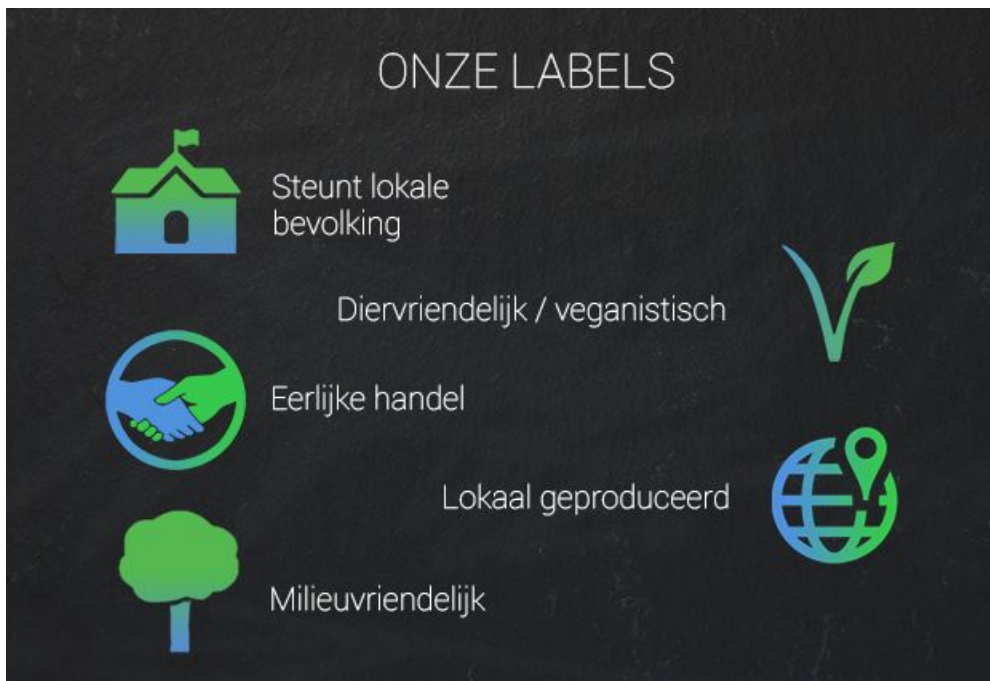
Afbeelding met onze 5 labels